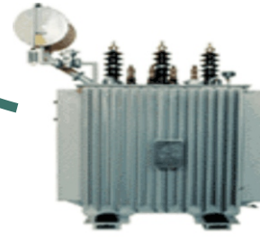
Contaminado con PCB